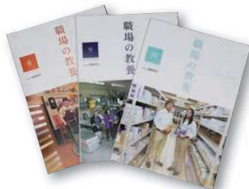
さいりん110、111号で「職場の教養」について詳しく解説しています。

会員企業だけに配布される非売品。1日1話、心に響く文章と「今日の心がけ」が書かれており、全国で多くの企業に活用されています。