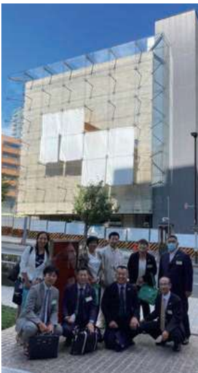
まだ建設途中の倫理研究所ビル(行動ホール予定?)を背景に記念撮影