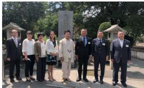
多磨霊園にある丸山敏雄創始者の墓前で記念撮影