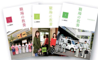
さいりん110、111号で「職場の教養」について詳しく解説しています。

会員企業だけに配布される非売品。1日1話、心に響く文章と「今日の心がけ」が書かれており、全国で多くの企業に活用されています。