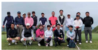
寄居・秩父倫理法人会 ゴルフ大会