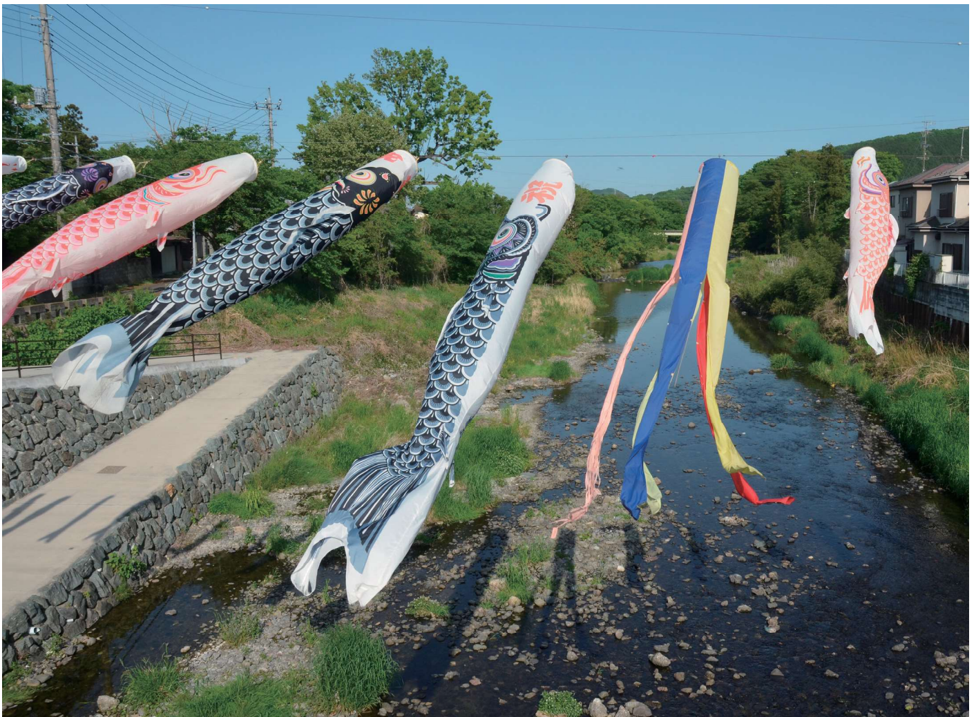
槻川(つきがわ)の鯉のぼり 毎年5月近くなると、小川町中心部の槻川にワイヤーが渡され、大きな鯉のぼりが飾られる。槻川の澄んだ清流と青空を背景に泳ぐ鯉たちは、とても気持ち良さそうだ。今年も元気な姿が見られるだろうか。(撮影地:比企郡小川町)