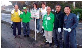
行田市倫理法人会 ロードサポート