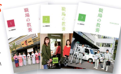
さいりん110、111号で「職場の教養」について詳しく解説しています。

会員企業だけに配布される非売品。1日1話、心に響く文章と「今日の心がけ」が書かれており、全国で多くの企業に活用されています。