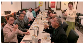
熊谷市倫理法人会