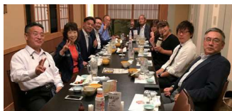
深谷市倫理法人会