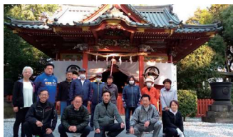
本庄市倫理法人会 神社清掃